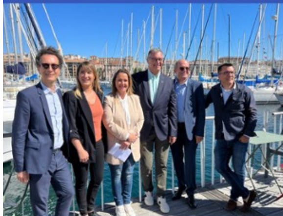
Medinsoft associé au Club AMP24 et au Fonds Héritage Sport Provence-Alpes-Côte d'Azur vont sélectionner les athlètes.

1 - L'info du jour : Medinsoft veut aider les athlètes marseillais à se reconverter après les JO 🏆