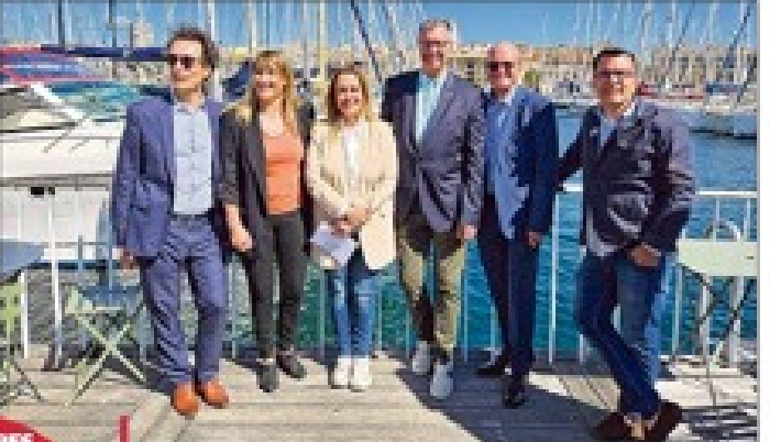
L'équipe de Medinsoft, entourée des représentants du Club AMP 2024 et du Fonds Héritage Sport pour lancer ce défi olympique individuel des entreprises de la tech.

À la fin de leur carrière, il est parfois compliqué pour les athlètes de se projeter sur le marché de l'emploi. Comment envisager cette reconversion professionnelle avant la fin de l'activité sportive ? Alors que plus de la moitié des sportifs de haut niveau vivent avec le soleil de pénurie, certains ont la chance d'être accompagnés par des équipes de soutien pour trouver des financements pour les Jeux olympiques, avec parfois un CDI à la clé. Mais ce n'est pas le cas de tous.